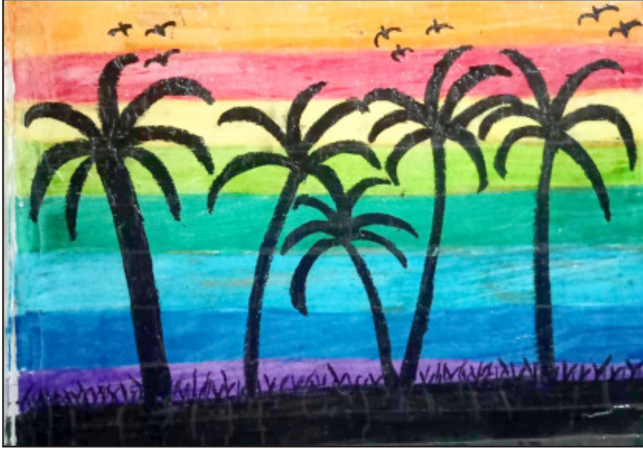
প্ৰেৰণা দলে ষষ্ঠ শ্ৰেণী, জ্ঞান জ্যোতি একাডেমী, নাৰায়ণপুৰ